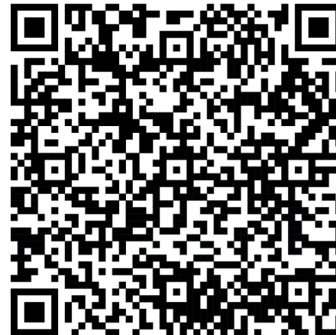
Evaluación de desempeño