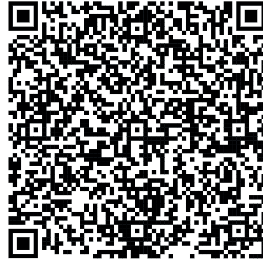
Código Carta de Término

Nota: El alumno será responsable de verificar en su Escuela o Facultad que otros requisitos internos requiere para la finalización.