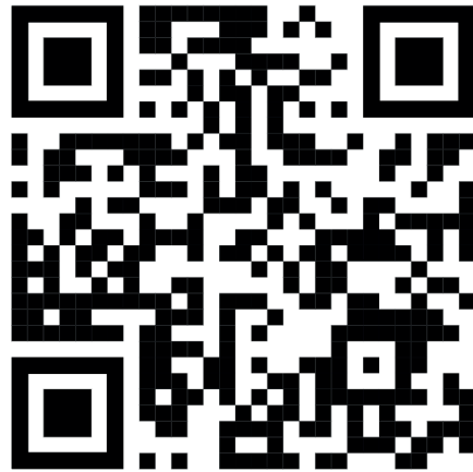
Código facebook DSSyPP

Teléfono 8183294000 ext. 5156,4235 y 5202