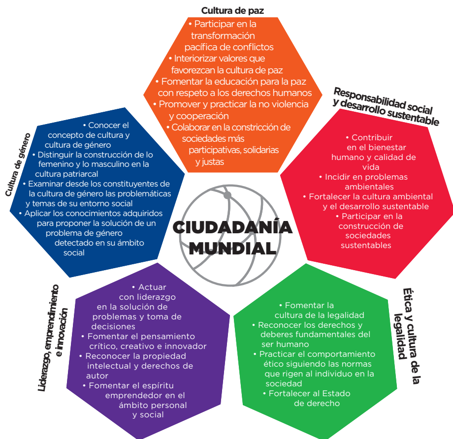
GRÁFICO 2. Intenciones de las unidades de aprendizaje del ACFI-G para el logro de la ciudadanía mundial.

procesos de adopción de decisiones políticas y económicas, se estarán impulsando las economías sostenibles y las sociedades y la humanidad en su conjunto se beneficiarán al mismo tiempo (ONU, 2019). Estableciendo nuevos marcos legales sobre la igualdad de las mujeres en el lugar de trabajo y la erradicación de las prácticas nocivas sobre las mujeres es crucial para acabar con la discriminación basada en el género que prevalece en muchos países del mundo, incluyendo el nuestro.