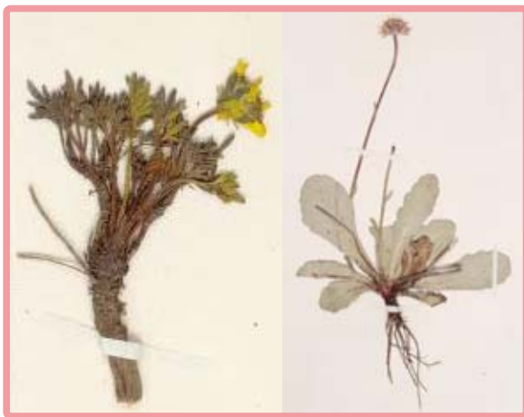
Thelesperma muellerii (izq.) y Erigeron wellsii (der.), especies restringidas a la vegetación alpina del noreste de México.