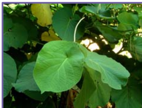
Hoja e inflorescencia de Hierba santa.