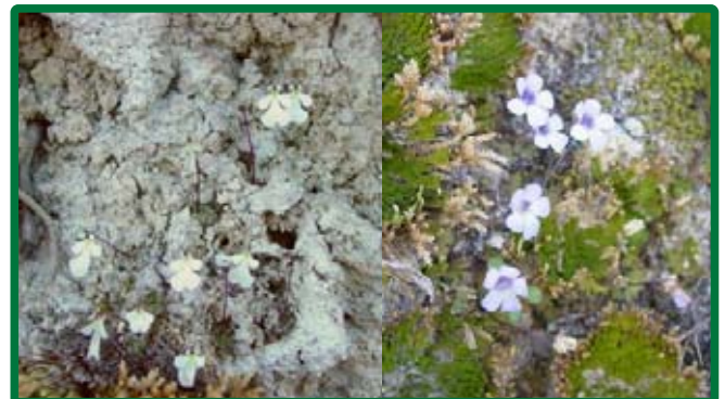
Las áreas gypsófilas son refugio de muchas especies endémicas. Por ejemplo, Pinguicula rotundiflora (der.) y P. Immaculata (izq.), son dos especies de distribución restringida a este tipo de zonas en N.L.

más socorridas para la protección de especies es la llamada Norma Oficial Mexicana NOM-059-SEMARNAT-2001, en la cual se enlistan las especies dentro de alguna categoría de riesgo, la cual data ya desde el año de 1994 y fue modificada en el año 2001 para darnos el listado de especies protegidas con el que cuenta México en la actualidad.