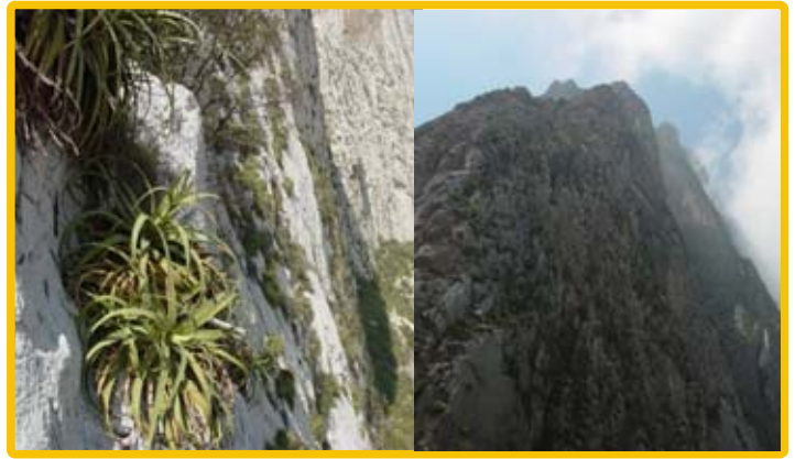
Casi cualquier pared vertical en la Sierra Madre, es hábitat propicio para Agave bracteosa . "La Huasteca", Santa Catarina, N.L. (izq.) Y Sierra "El Fraile", Hidalgo, N.L. (der.)

Ahora bien, ¿Cuál es la verdadera utilidad de incluir especies en esta norma? proveer bases para la toma de decisiones por parte de las autoridades, sin duda alguna. Sin embargo, esta lista debería de representar la prioridad para el conocimiento y conservación de especies en México, no solamente en letra, sino en acción, veamos lo siguiente, en años pasados la CONABIO, lanzó una convocatoria para el conocimiento de las especies incluidas en esta norma, de manera sorprendente, la mayoría de las especies que hoy en día cuentan con una ficha informativa disponible en la página de la COANBIO (por lo menos en plantas), son en su mayoría del área de Baja California, parte de Sonora y zonas de bosque mesófilo en el sur de México, existe muy poca información de las especies del noreste.