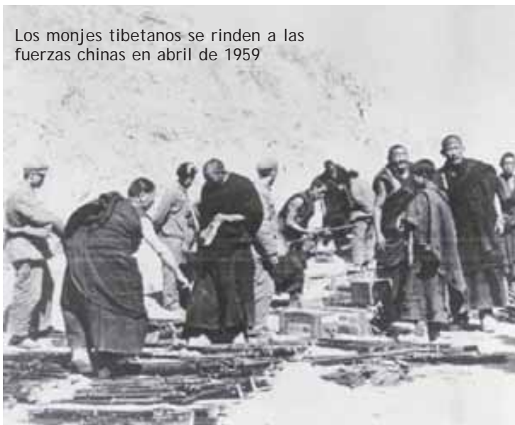
Los monjes tibetanos se rinden a las fuerzas chinas en abril de 1959

Unidas (ONU) examinara su caso. El Salvador propuso la inclusión de la cuestión de Tibet en la agenda de la Asamblea General, pero no recibió apoyo. En razón de lo anterior y ante la amenaza del uso de la fuerza del Gobierno chino, Tibet firmó el Convenio de los Diecisiete Puntos el 23 de mayo de 1951. 5 A través de dicho convenio Tibet aceptaba la entrada del Ejército chino en su territorio y el estatus de autonomía regional bajo la dirección del Gobierno central chino, entre otras cosas. Por su parte, el Gobierno chino se comprometía a no modificar el ordenamiento político tibetano, respetar la libertad de religión y el derecho del Tibet a mantener relaciones comerciales con los países vecinos. No obstante lo anterior, según el Dalai Lama, el Gobierno chino nunca cumplió con lo establecido en el convenio.